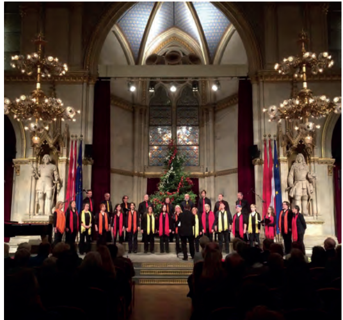
Konzert im Rathaus am 20DEC14